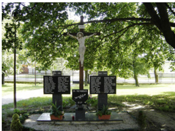
Pamätník obetiam z oboch vojen

Na pamiatku občanom Jaroviec, ktorí padli počas bojov v 1. a 2. svetovej vojne, bol pri Kostole sv. Mikuláša v roku 1992 vybudovaný pomník