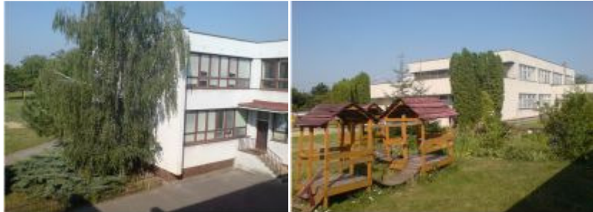
Budova školy v Jarovciach

Základná škola s materskou školou sídli na Trnkovej ulici č. 1 a zamestnáva 32 pracovníkov.