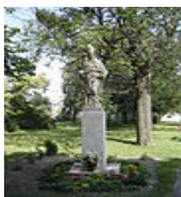
Socha sv. Mikuláša

K zaujímavostiam Jaroviec patrí aj Socha Svätého Mikuláša a pamätník obetiam z oboch vojen.